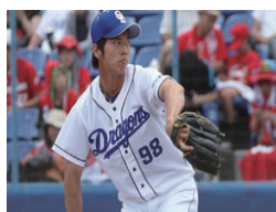
心筋炎 木下投手 (27) 死亡

帯状疱疹やカンジタ症は免疫低下によって起こります。ワクチン接種により自己免疫の異常が起こっています。自己免疫疾患が多数報告されています。